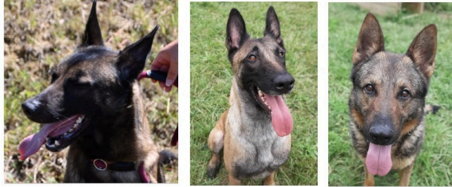
Deux belles Malinoises et un beau Berger allemand cette semaine !

Cette semaine, la SPA met à l'honneur trois animaux arrivés il y a quelques semaines au refuge, Mamy et Tiana, deux Malinoises, et Loukie, un Berger allemand.