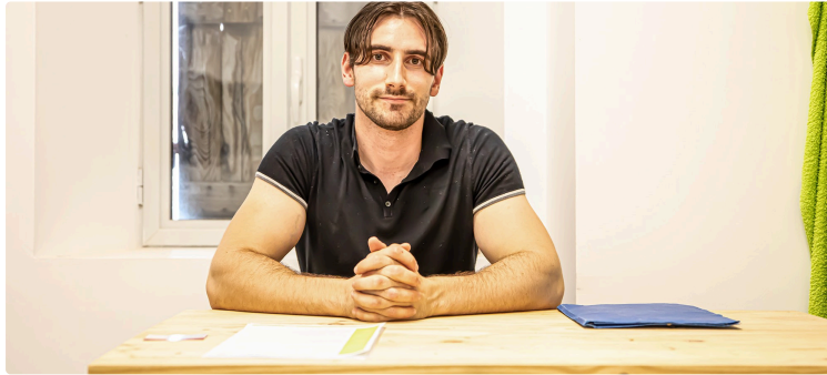
Un nutritionniste s'installe à Nogaro et à Éauze

Il propose un coaching personnalisé à qui veut faire du sport et/ou maigrir