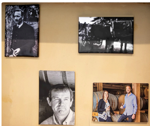
4 générations de la famille Gessler