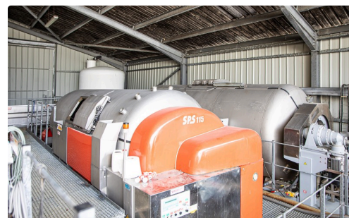
Pressoir pneumatique et pressoir à rouleaux