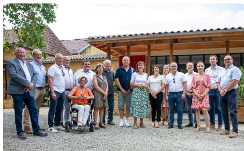
Hôtes et visiteurs