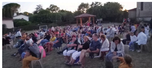
Les spectateurs lors de la séance de cinéma.