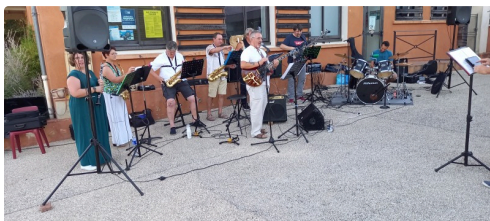
Un orchestre a égayé la soirée.