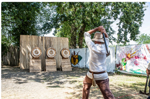
Lancement de hache ( en 2019)