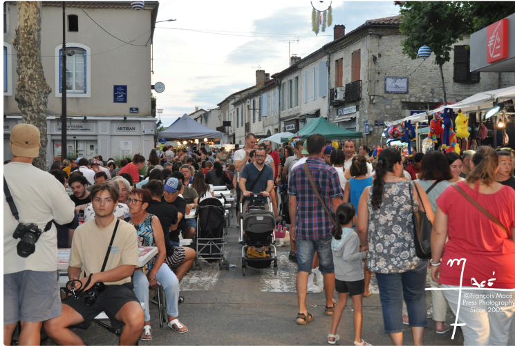
Troisième marché de nuit de la saison !

Mercredi soir, aura lieu dès 19 h le troisième marché de nuit de l'été.