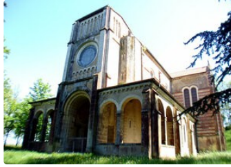
Marciac: Expositions à la chapelle Notre Dame.

Plus que quelques jours pour y faire un tour.