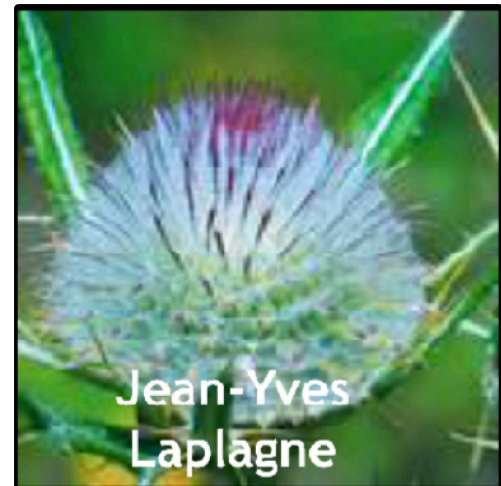
jean yves laplagne.png