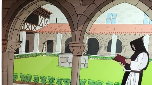
Mais où est passé frère Mathieu ?

Grand retour de l'escape Game à l'abbaye de Flaran