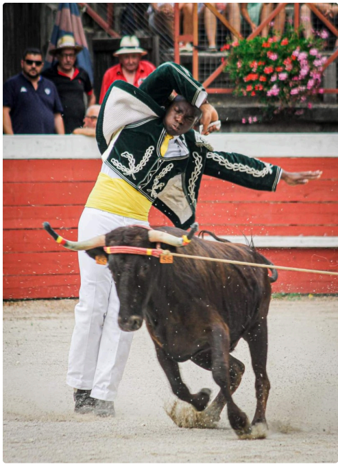
démo course landaise.jpg