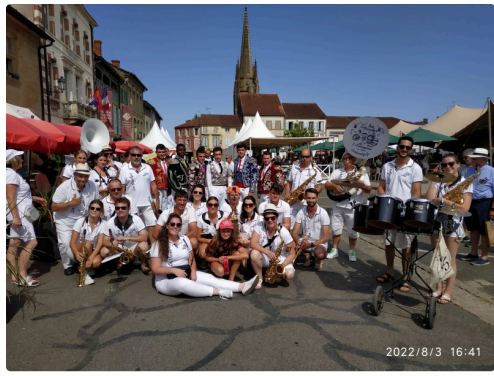
devant la mairie photo groupe.jpg