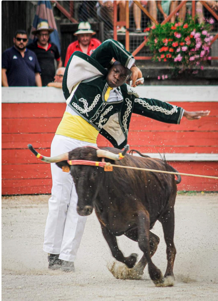
Des courses landaises pour les festivaliers.

Ce mercredi 3 août 2022, une course landaise de démonstration a été offerte aux arènes de Marciac.