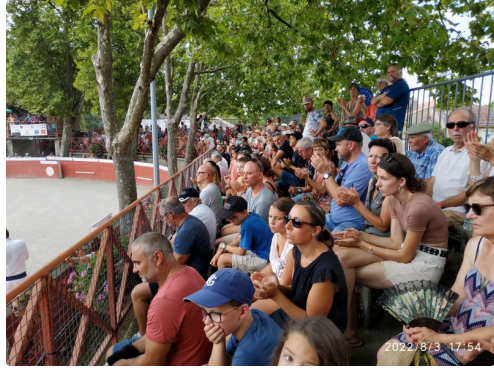
les spectateurs 2.jpg