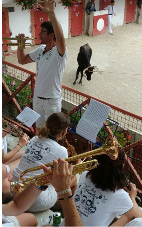
les dandy's ds les arenas.jpg