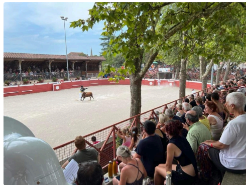
arenas marciac 3.jpeg