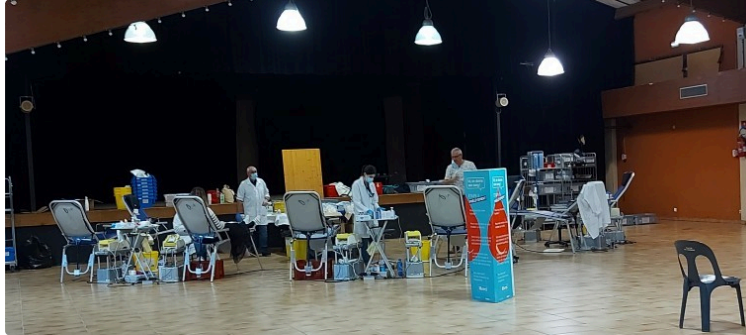
En 1 heure, vous pouvez sauver 3 vies ! Venez donner votre sang !