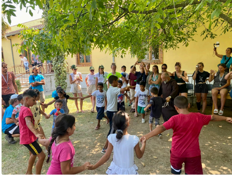
Suite des aventures de l'équipage EUFASO sur la route de l'Europ'raid 2022 !

Nous les avons quittés à la frontière croate direction la Bosnie-Herzégovine, le Montenegro et l'Albanie.