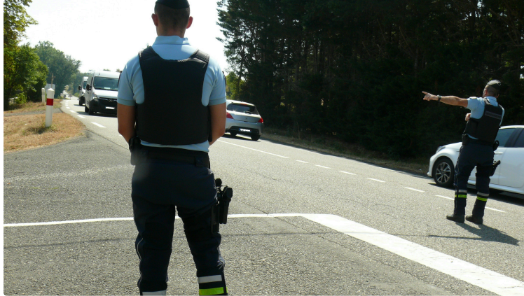
Police et gendarmerie du Gers : vigilance accrue durant ce chassé-croisé du 15 août