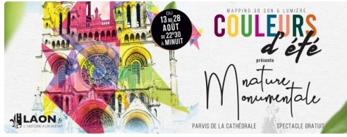
Place au spectacle numérique

Contact Rémy Laurençon : 06 66 89 32 31 ou remylauren@gmail.com