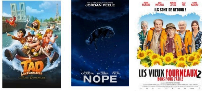
Animation, science-fiction et comédie au cinéma mercredi