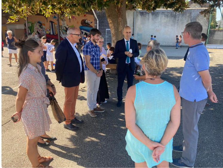
Une rentrée sous les meilleurs auspices

Le maire bien accompagné pour la rentrée scolaire