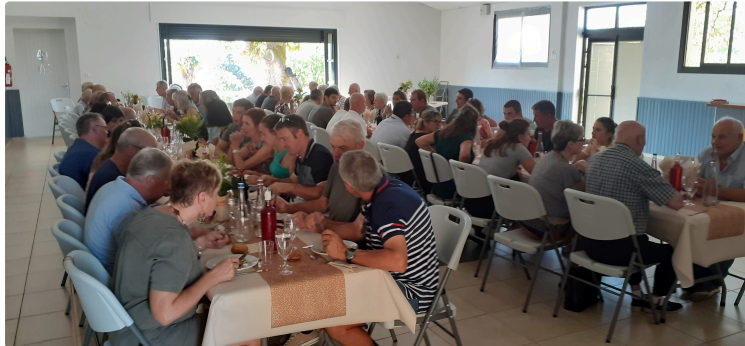
La CUMA de Préneron a fêté ses 91 ans !

Dimanche 4 septembre, la CUMA (Coopérative d'Utilisation de Matériel Agricole) de Préneron a fêté ses 90 + 1 an à la salle des fêtes de Préneron .