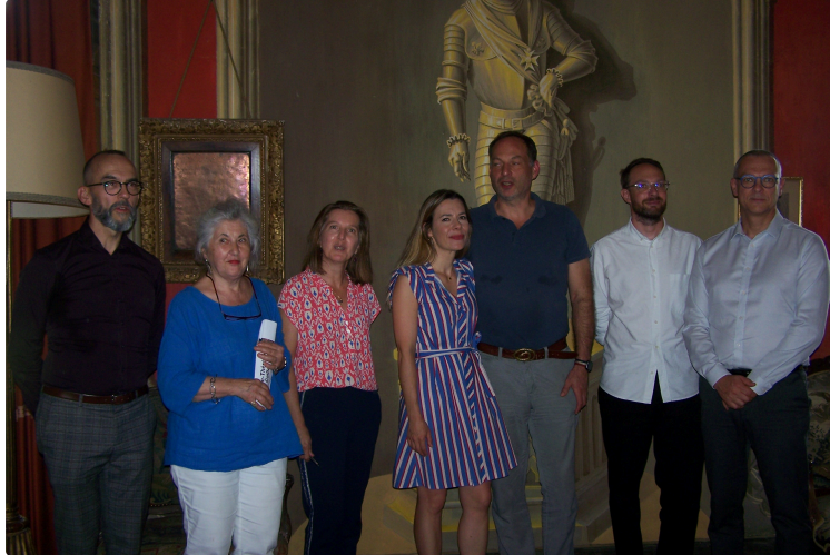
Des Cadets de Gascogne aux Mousquetaires du Roi : un événement culturel et artistique unique sur le territoire du Savès