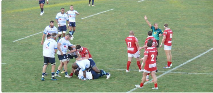
La fantastique remontada du RC Auch

Malmenés en première mi-temps, les Auscitains réussissent à revenir sur les Périgourdins pour les assommer par un drop à la dernière seconde de jeu