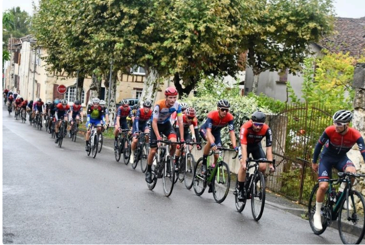
Fêtes de la Saint Matthieu : réglementation du stationnement et de la circulation

La fête locale aura lieu les 16, 17 et 18 septembre 2022