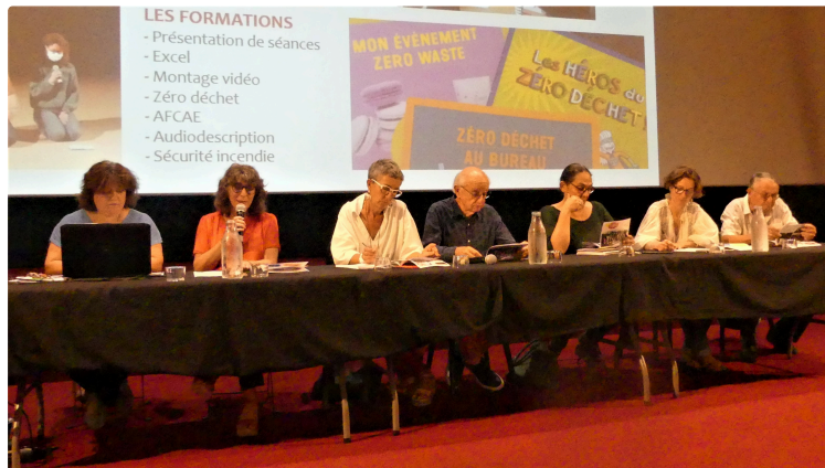
CINE32 poursuit sa route ...