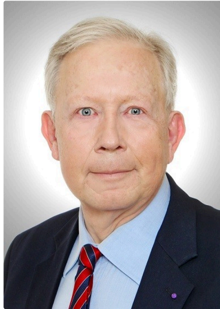
Renforcer notre euro, repenser l'Europe

Depuis 20 ans, l'euro reste une avancée stratégique inachevée.