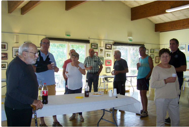
Une exposition des peintres amateurs des environs de Solomiac et d'ailleurs...