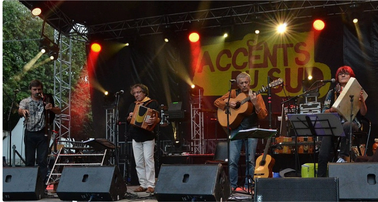
Journée gasconne - Eauze