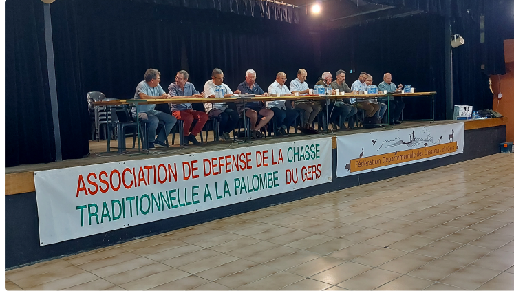
Réunion des chasseurs de palombes : des chasseurs inquiets quant au maintien des chasses traditionnelles