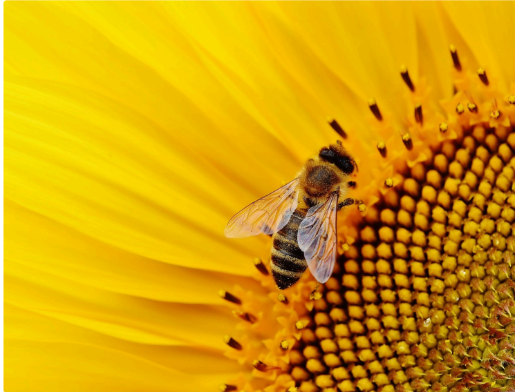
Le projet Mayage recrute des fermes pilotes

Communiqué de la communauté de communes Astarac Arros en Gascogne