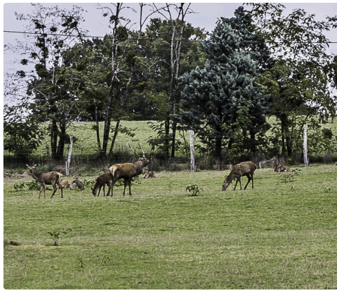
Cerf et biches