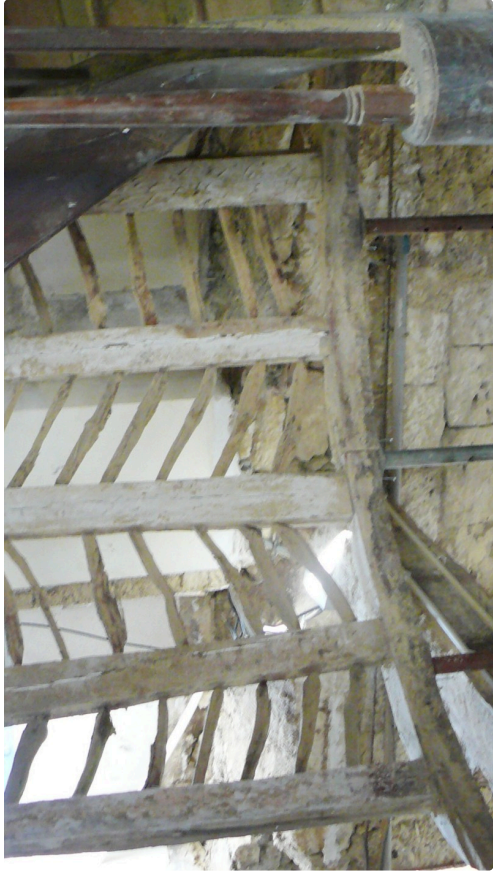
L'intérieur de la mairie.