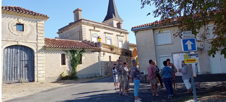
L'histoire au coeur du village

« L'histoire du cœur du village » de Duran a été l'occasion lors de la journée du patrimoine de découvrir son évolution au cours des siècles derniers à aujourd'hui. Un travail remarquable de recherches des adhérents de l'ASPAD durant une année qui a été mis au grand jour en visitant les divers édifices et en s'informant sur des panneaux installés aux quatre coins du village.