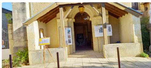
Le porche de l'église

https://www.youtube.com/watch?v=QI2GFNI256A