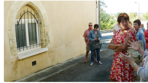
Baie en arc brisé, il s'agirait d'une porte médiévale (14e/15e s)