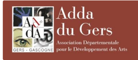
L' actu de l'ADDA du Gers en octobre

Marc Fouilland a réuni les acteurs des événements pour octobre