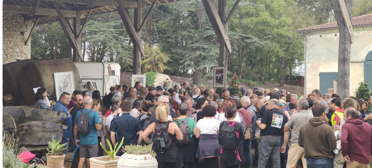
Label Rando par Label de Nuit : belle réussite de l'édition 2022 !

Pour la 2 ème année, l'association Label de Nuit avait organisé samedi 8 octobre Label Rando, une randonnée gourmande et artistique, au domaine d'Herrebouc, sur la commune de Saint Jean Poutge.