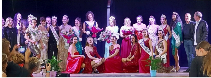
Un nouveau président pour le Comité Miss Élégance France

Samedi 15 octobre, aura lieu à Vic-Fezensac l'élection de Miss Élégance Gers Bigorre qualificative pour l'élection Miss Élégance Midi Pyrénées – qui se déroulera le 26 novembre à Moissac- elle-même qualificative pour Miss Élégance France 2023 qui aura lieu fin janvier.