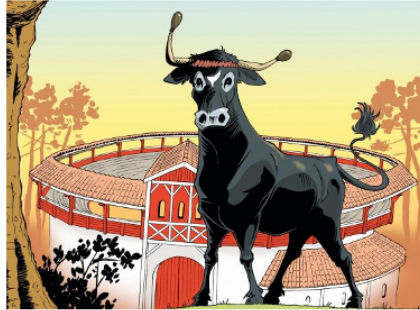
"Ironta, reine des arènes", l'univers de la course landaise en bande dessinée

Vient de sortir aux éditions Passiflore une bande dessinée, Ironta, reine des arènes , œuvre de Patrice Larrosa pour le texte et David Dupouy , illustrateur.