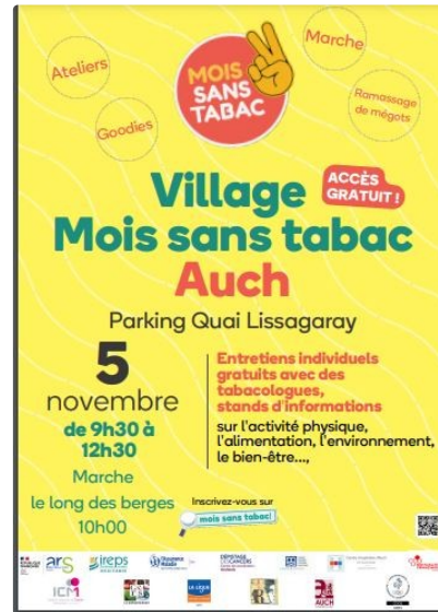
7 ème ## édition Mois sans tabac en Occitanie Auch

A Auch et dans toute l'Occitanie, une mobilisation importante