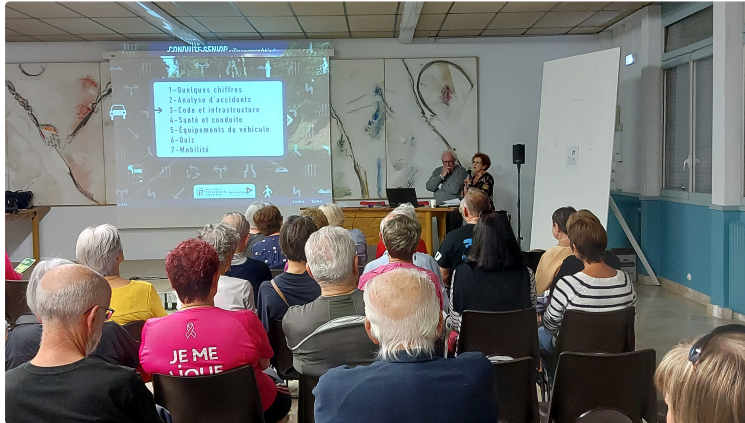
Une très utile séance de révision du code de la route !

L'association vicoise la Bienfaisance avait organisé samedi une séance de « révision » de la sécurité routière dans la salle des conférences de la mairie.