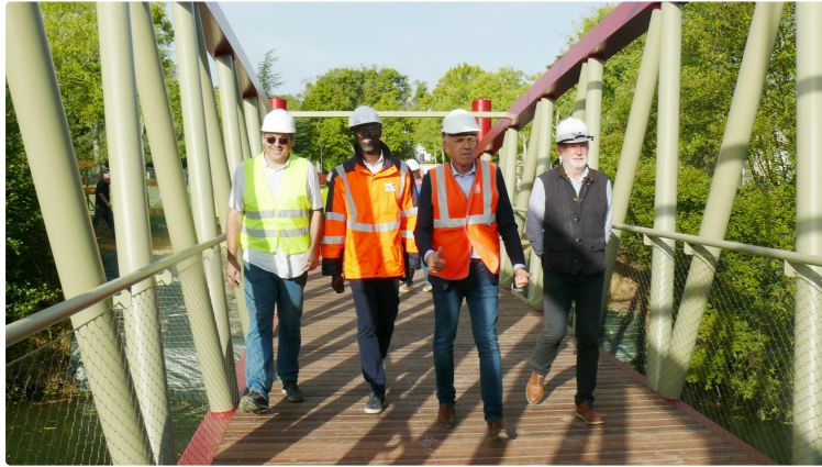
Une sixième passerelle posée sur le Gers

Elle permettra de relier la rue du 8 Mai au parc du Couloumé au niveau de la salle Ernest Vila.