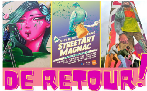
Le Festival Street Art'Magnac est de retour !

La 8ème édition du festival Street'Art'Magnac se déroulera