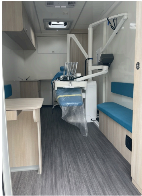
Le cabinet dentaire.