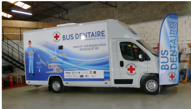
Unique en France, le bus dentaire

C'est une initiative de la Croix Rouge qui permettra de pallier à des soins dentaires en milieu rural