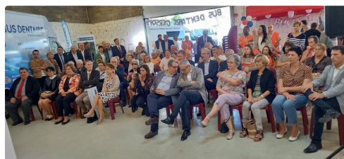
De nombreux élus étaient présents.