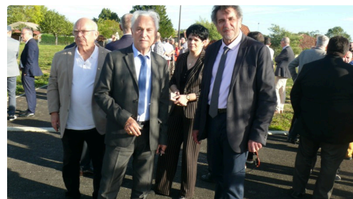
Visite du lotissement écoresponsable.