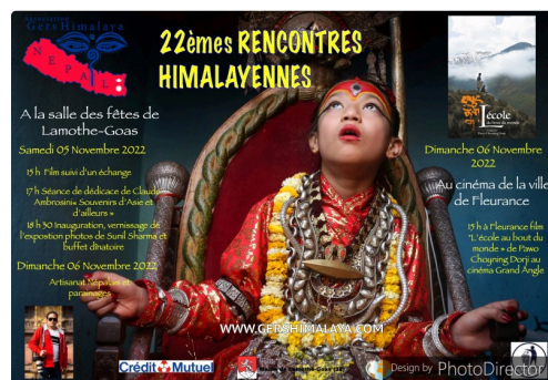
Sunilsharma_Living Goddess Kumari(1).jpg

15 H Adhésions et parrainages de scolarité d'enfants népalais, dons.