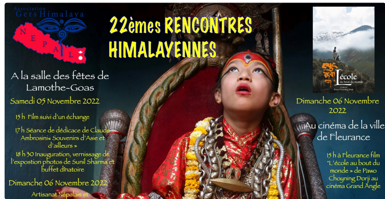
Les journées Himalayennes

Samedi 5 novembre et le lendemain dimanche 6 novembre, vont se dérouler les traditionnelles journées himalayennes, temps fort annuel pour l'association Gers Himalaya. Cette année des animations seront sur deux sites : Lamothe Goas et Fleurance, dans le Gers.