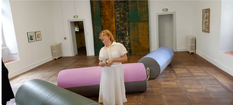
Memento : une fréquentation en hausse de 15% pour l'exposition 2022

Le Département dresse le bilan de la saison sur l'exposition « Résidence secondaire ».