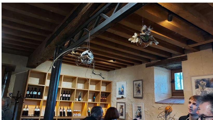
...un dialogue rempli de sensibilité et de délicatesse.