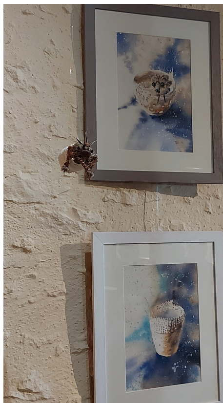
...que les céramiques de Luce accueillent les créatures de Sylvain comme des sortes de matrice...