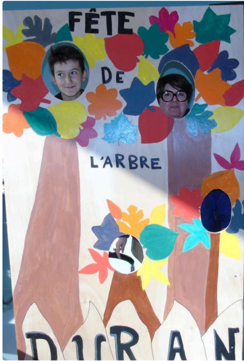
photomaton made in Duran