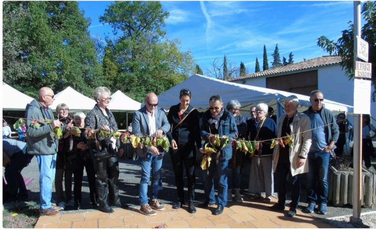
17 ème Fête de l'Arbre 2022 : une superbe journée pour le chaland