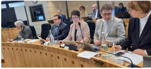
L'opposition a voté contre le passage de la flamme olympique