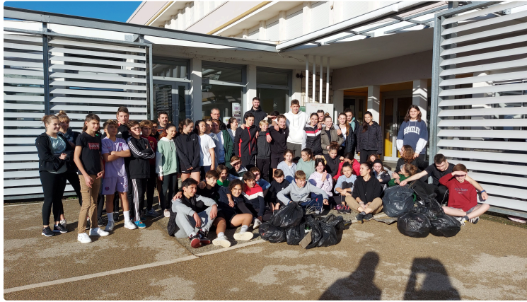
Une journée autour des valeurs de partage, biodiversité, respect et entraide au collège Gabriel Séailles

Les ateliers communs à toutes les classes