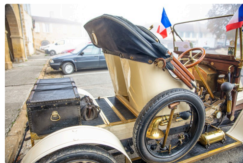
4 La Renault AX de 1909 côté droit 1bis 111122.jpg