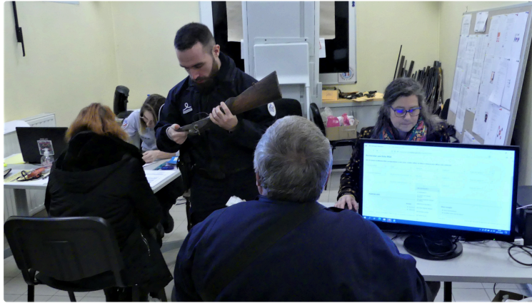
Rendez vos armes citoyens ! date limite vendredi 2 décembre 17h00

Sécurité, opération nationale d'abandon simplifié d'armes à l'Etat dans le département du Gers