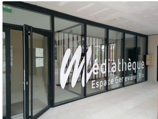
Le mois de décembre à la Médiathèque municipale Encore des nouveautés

Découvrez l'exposition de Maurice Augizeau, du 02 au 27 décembre en partenariat avec l'office de tourisme Val de Gers.