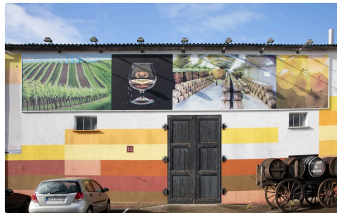
Façade des Hauts de Montrouge