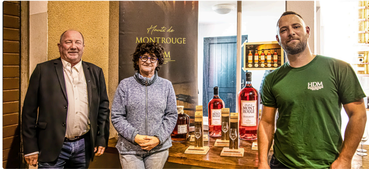
Célébration du triomphe des Hauts de Montrouge au Concours des Armagnacs d'Éauze

La coopérative manifeste sa fierté à ses partenaires