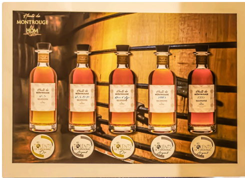
Les 5 Armagnacs primés