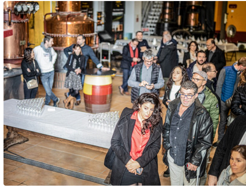
Les invités écoutent l'explication de la distillation