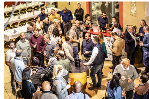
Dégustation en cours