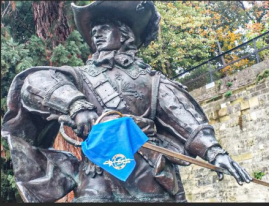
La statue de d'Artagnan à Maastricht avec le foulard de l'association