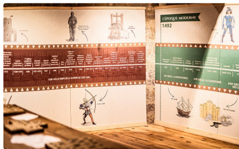
Suite des Repères historiques