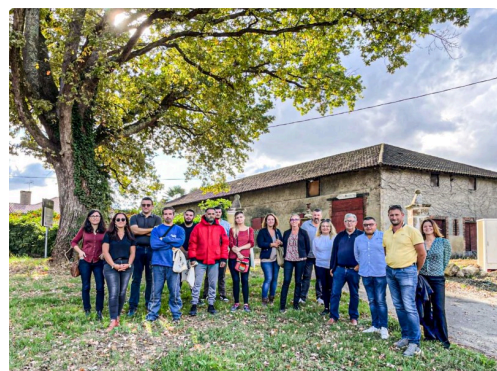
Demandeurs d'emploi, partenaires et GE 4 Saisons à Malartic (photo communiquée par GE 4 Saisons)